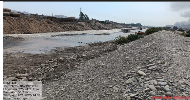
ZONA COLMATADA DEL RIO RIMAC